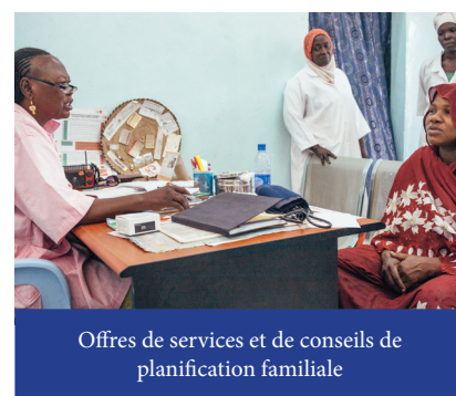
Offres de services et de conseils de planification familiale

Au sortir de cette réunion, nous devons ensemble pouvoir définir comment mieux rapprocher les produits des utilisatrices et permettre aux bénéficiaires du SWEDD, les femmes et les filles, de prendre des décisions qui contribueront, de manière durable, au développement de leurs communautés.