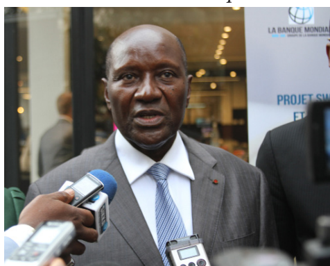
M. Daniel KABLAN Duncan Premier Ministre, Ministre de l'Economie, des Finances et du Budget

développement de nos Pays. Au nombre des leviers de ce processus,