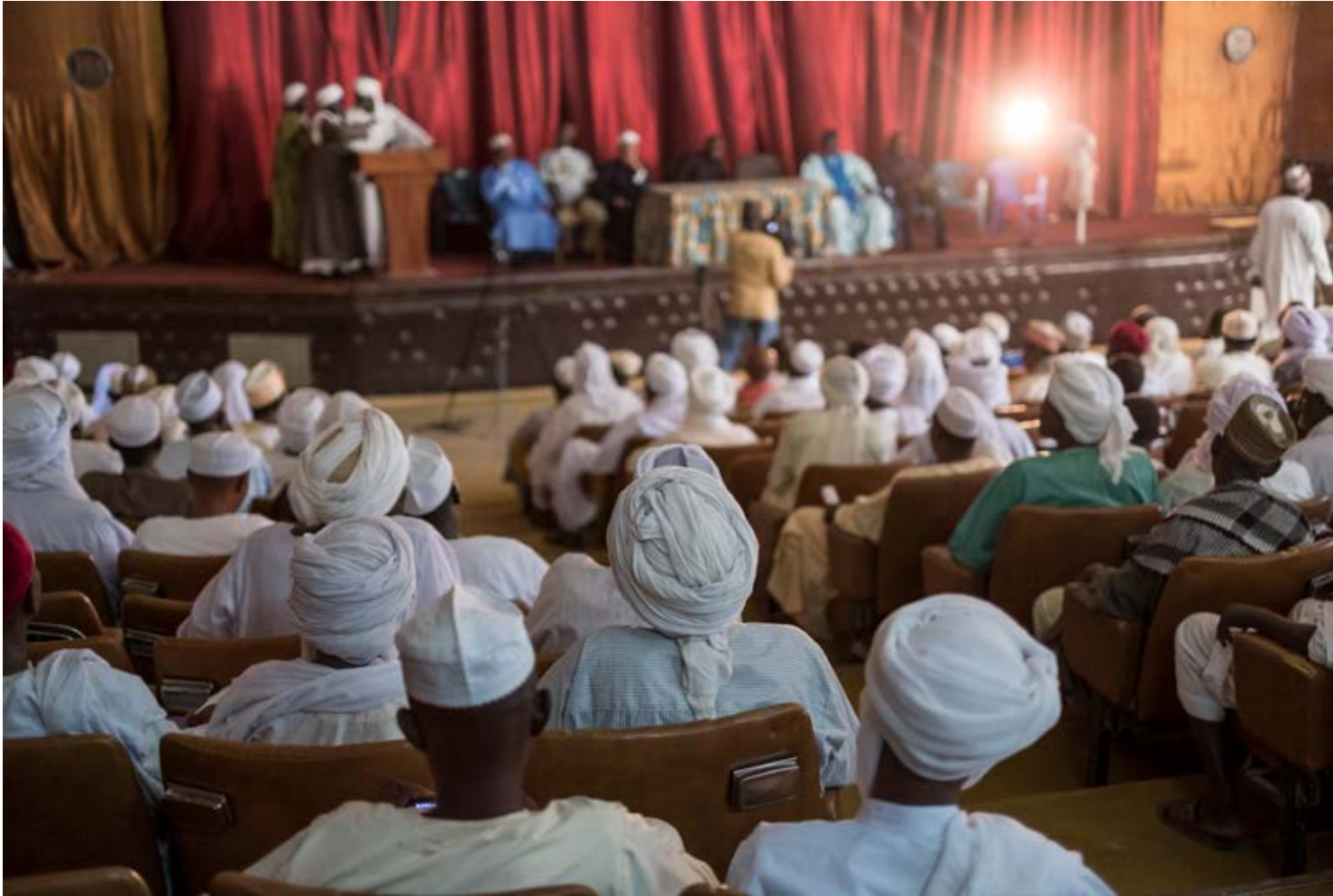
N'Djamena Symposium in Tchad.

A cet effet, l'UNFPA s'est attelé à organiser des rencontres avec les leaders religieux pour les informer sur les enjeux du dividende démographique, la santé de la mère et de l'enfant et sur les pratiques néfastes et dégradantes qui affectent les femmes et les filles.