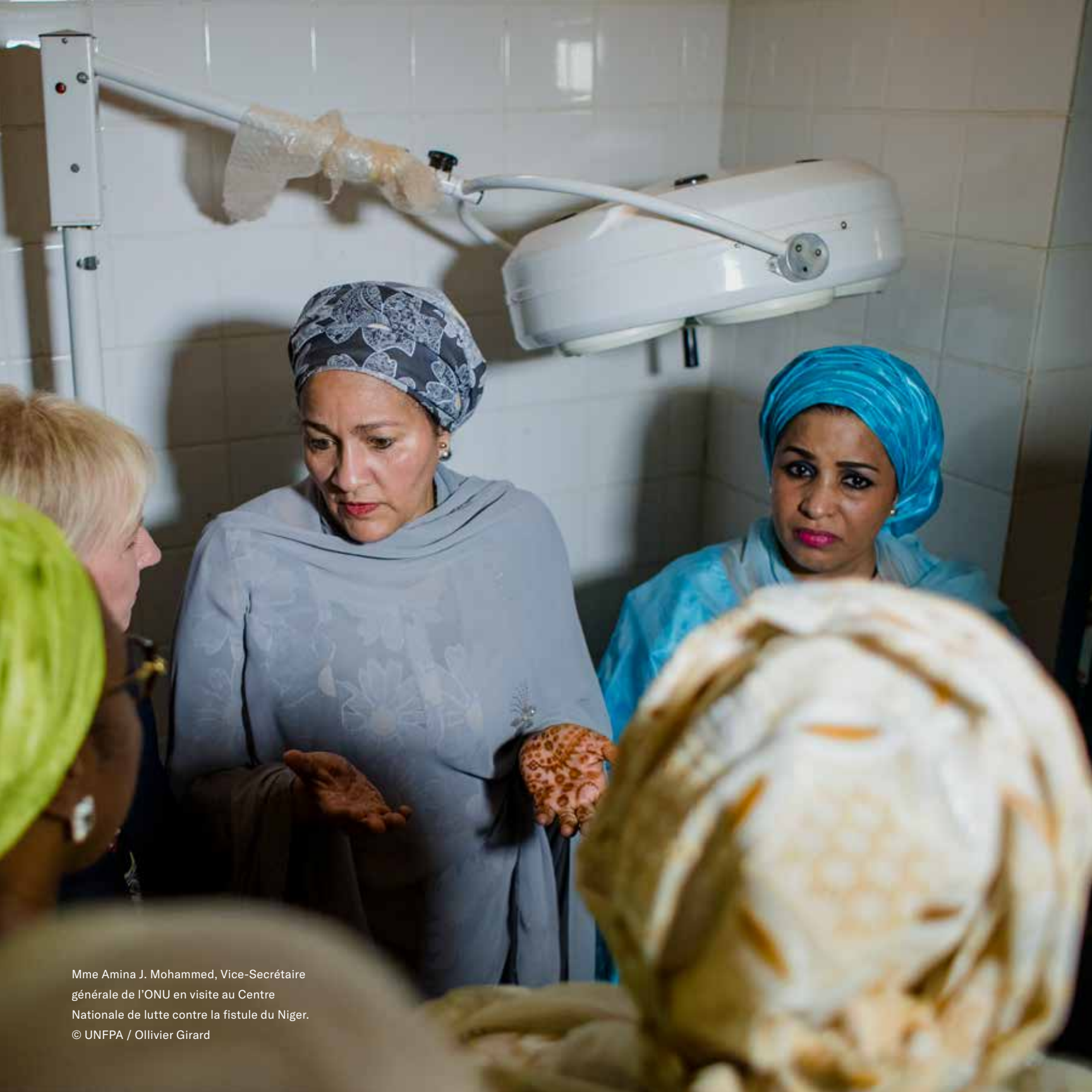
Mme Amina J. Mohammed, Vice-Secrétaire générale de l'ONU en visite au Centre Nationale de lutte contre la fistule du Niger.