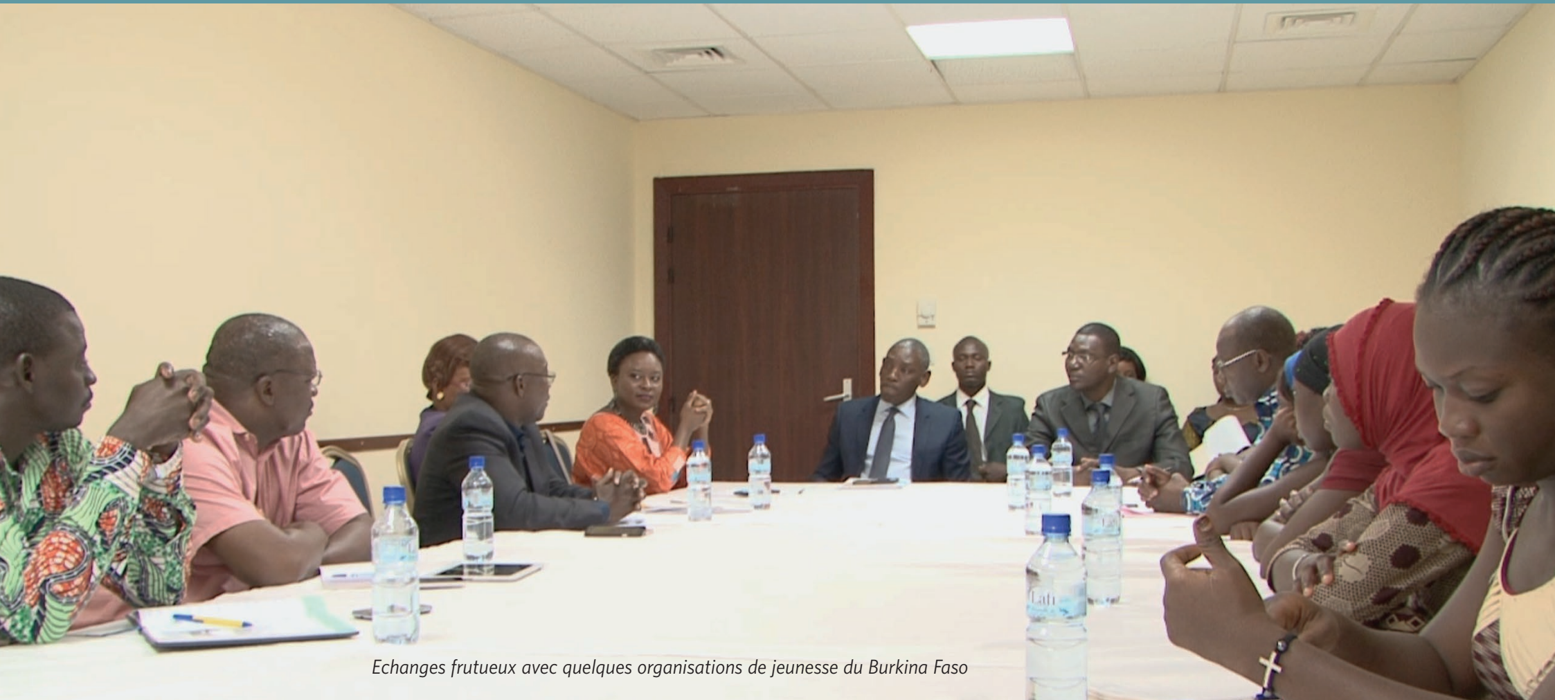
Echanges fructueux avec quelques organisations de jeunesse du Burkina Faso

Le 18 juillet : Quelques organisations de jeunesse du Burkina ont eu l'opportunité d'échanger avec le Directeur Régional. Pour lui il faut que les gouvernants africains impliquent d'avantage les jeunes dans leurs actions et agenda afin de construire une Afrique plus forte. Il a également invité les jeunes à contribuer plus intensément au processus de développement car c'est leur mobilisation qui induira des changements positifs et des lendemains meilleurs pour tous.