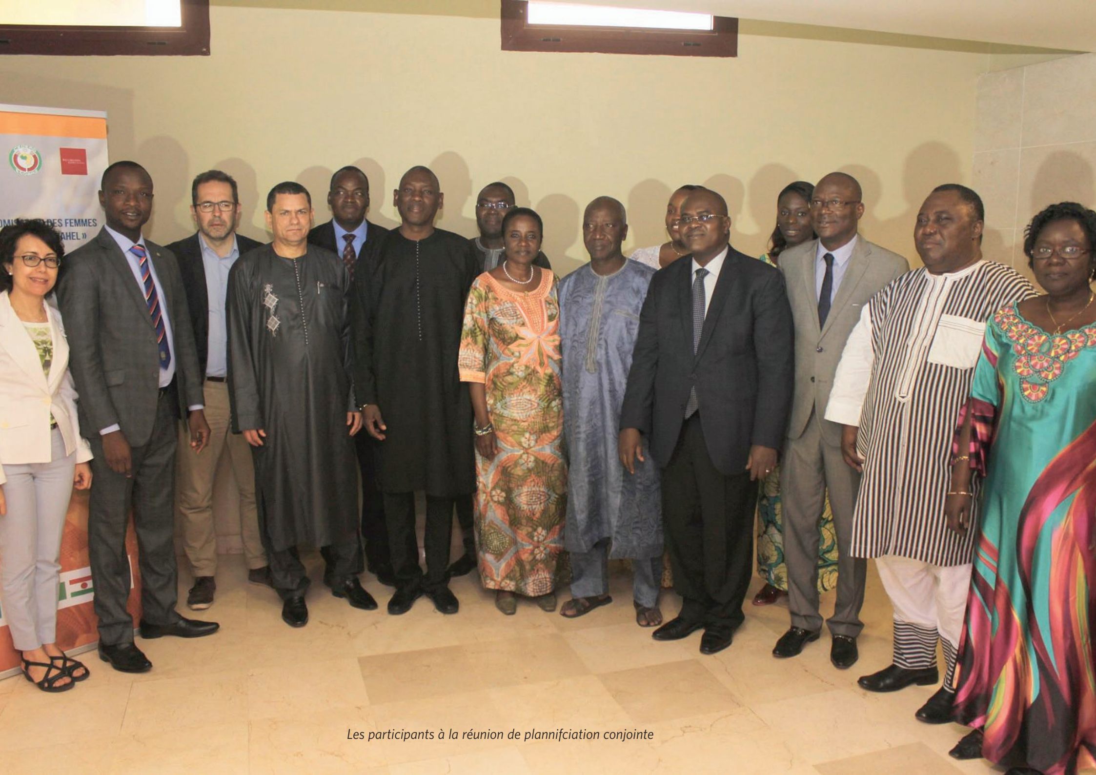
Les participants à la réunion de planification conjointe