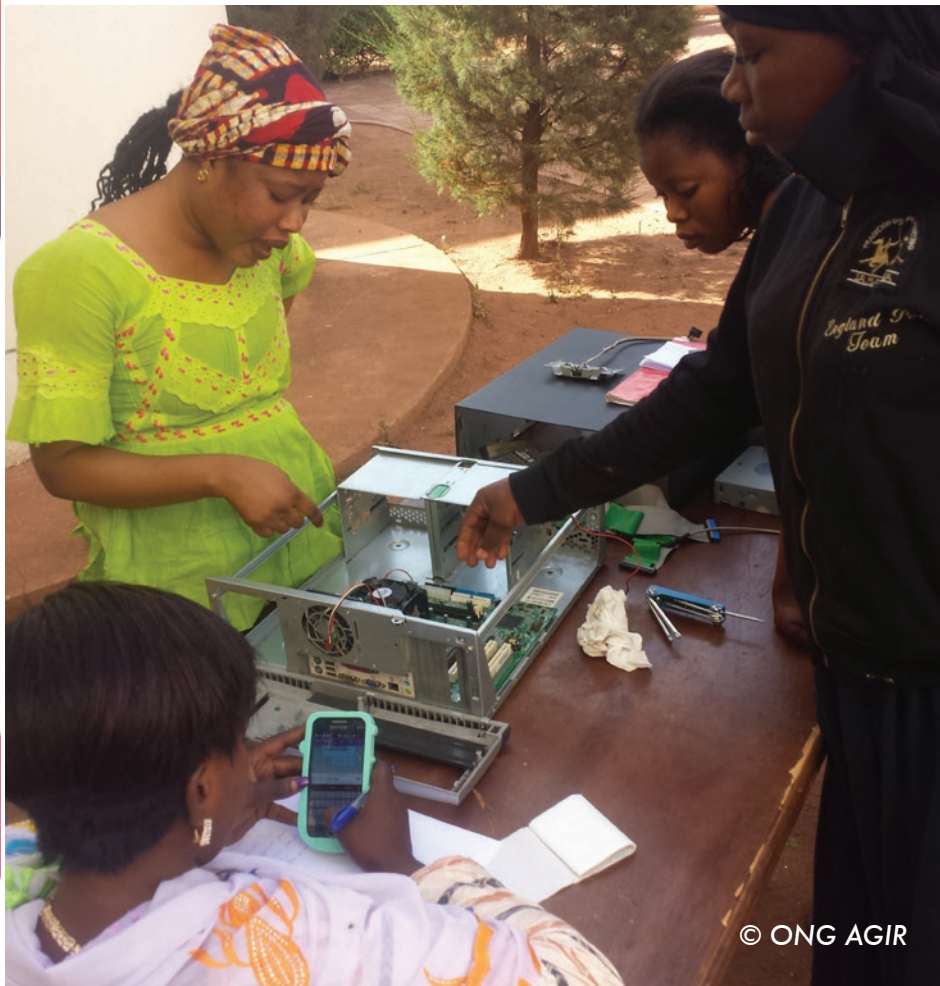
Filles au sein du Centre de Formation en maintenance informatique, Bamako

Les centres pour l'autonomisation des adolescentes et des jeunes filles constituent un espace d'expression pour les jeunes, hommes et femmes, des localités où ils sont implantés.