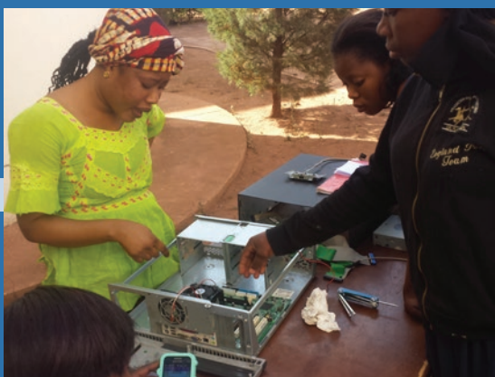
Les Centres de la seconde chance